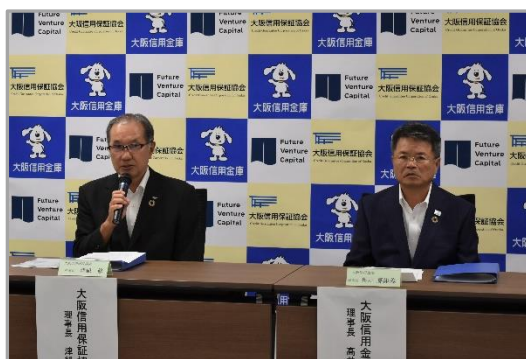
(挨拶をする津組理事長)

今後も、当協会は地元金融機関や関係機関と連携して、中小企業金融の円滑化、大阪の産業振興と経済発達に努めてまいります。