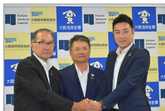
(握手を交わす三者)