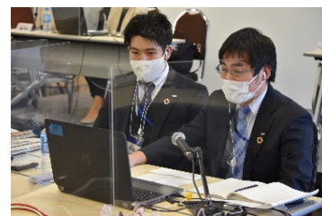
< オンライン相談の様子 >

利用されたお客さまからは「親身に相談にのっていただき、課題が鮮明になった。」「今後改めて相談できればと感じた。」「弊社のような零細企業にとっては非常に助かる。」などの感想をいただきました。