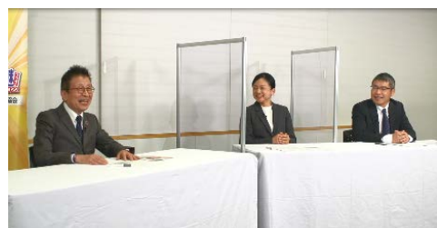
<トークセッションの様子>

基調講演・セミナーについては1週間のアーカイブ配信も行い、多くの皆さまにご視聴いただきました。