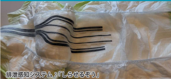
排泄感知システム：「しらせるぞう」