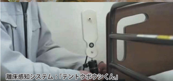
離床感知システム：「テントウボウシくん」